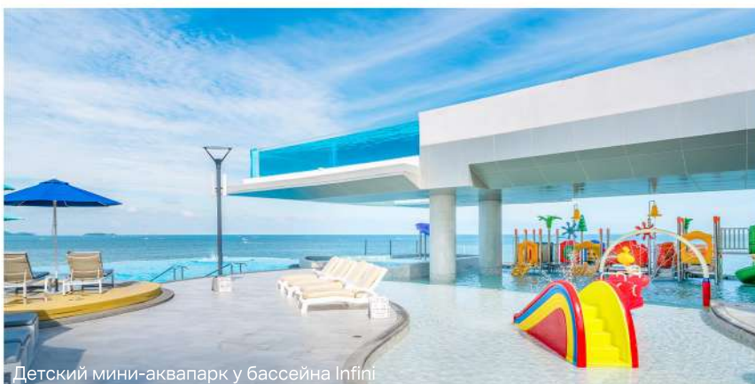
Детский мини-аквапарк у бассейна Infini