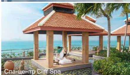
Спа-центр Cliff Spa