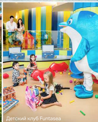
Детский клуб Funtasea