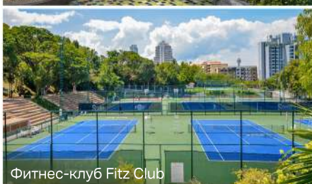
Фитнес-клуб Fitz Club